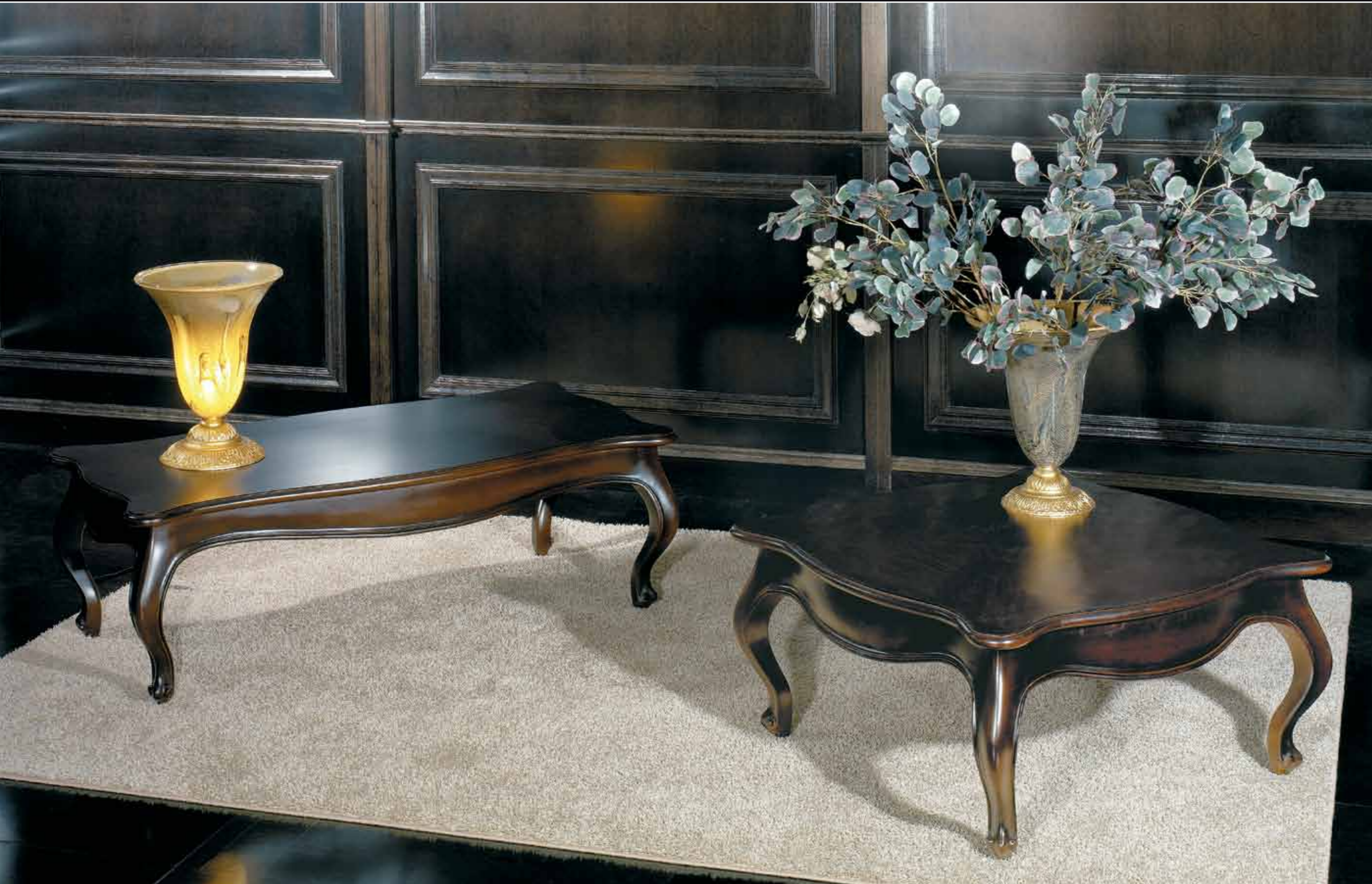
Art. 867 Tavolino rettangolare Art. 868 Tavolino quadrato Col. 23 Noce scuro