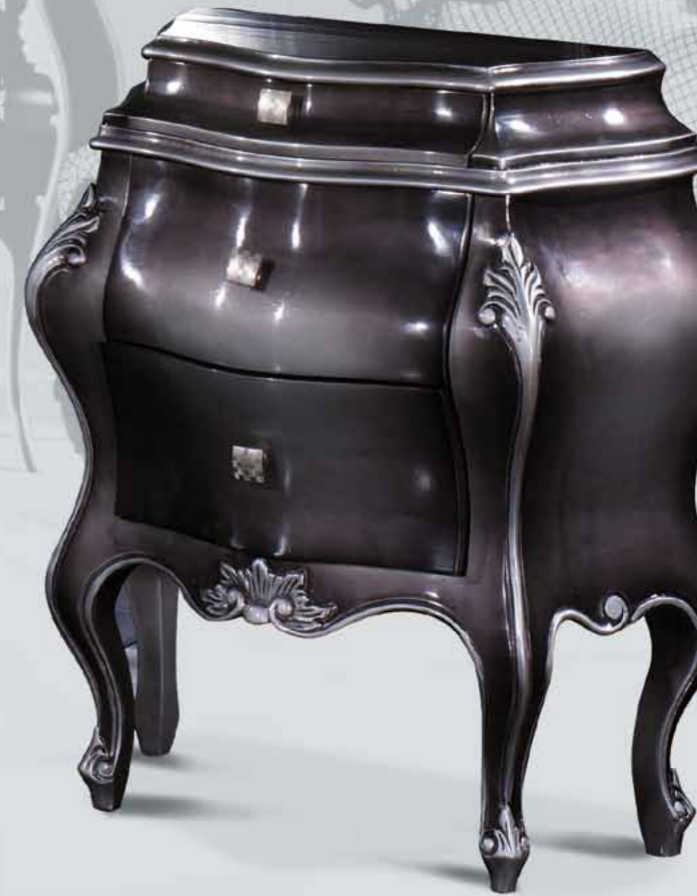
Col. 35 Grigio fiume