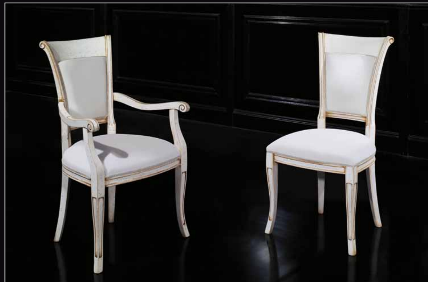
Art. 890 Sedia Col. 29 Bianco antico