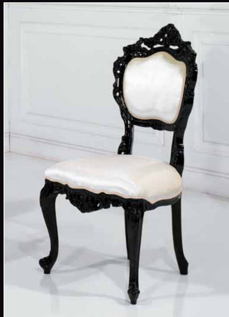
Art. 885 Sedia Col. 37 Nero lucido