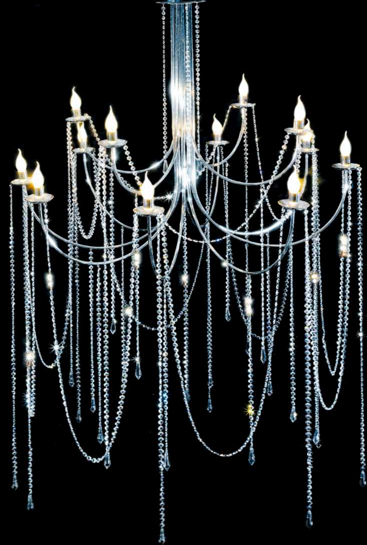
Art. 221 Lampadario 12 luci