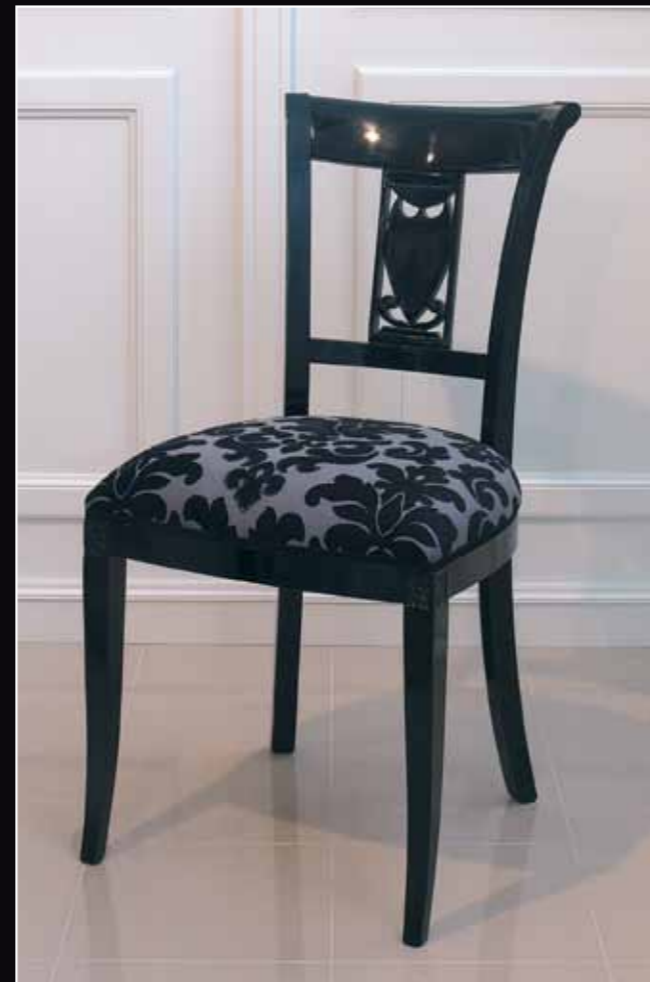
Art. 889 Sedia Col. 37 Nero lucido