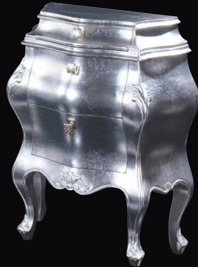
Art. 877 Comodino Col. 24 Foglia argento