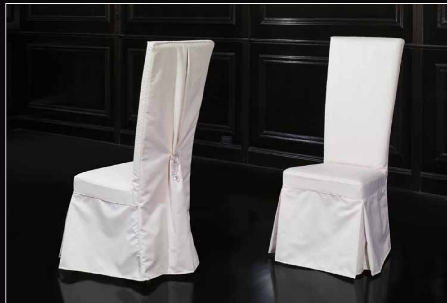
Art. 891 Sedia Col. 29 Bianco antico