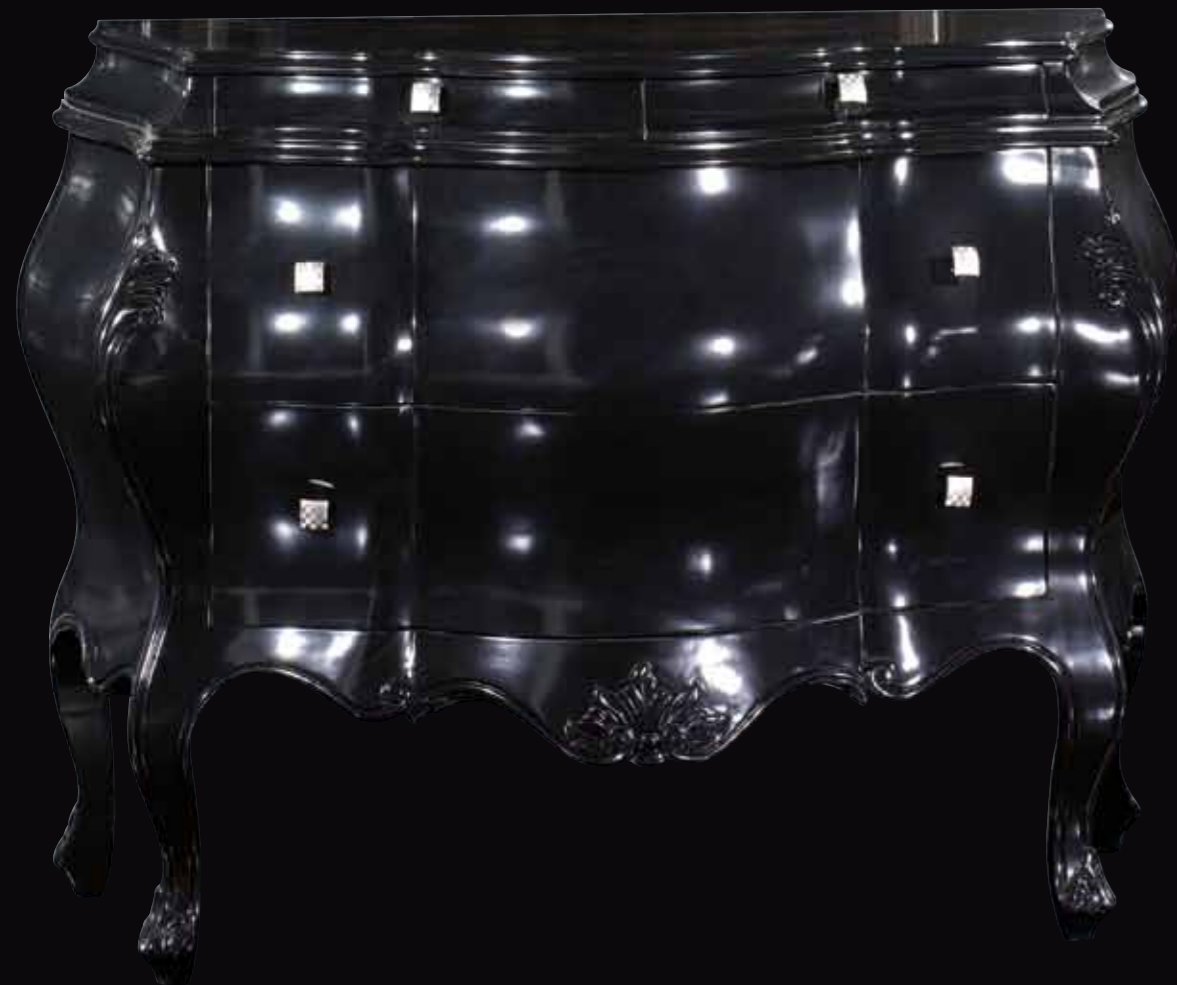
Art. 876 Comò Col. 37 Nero lucido