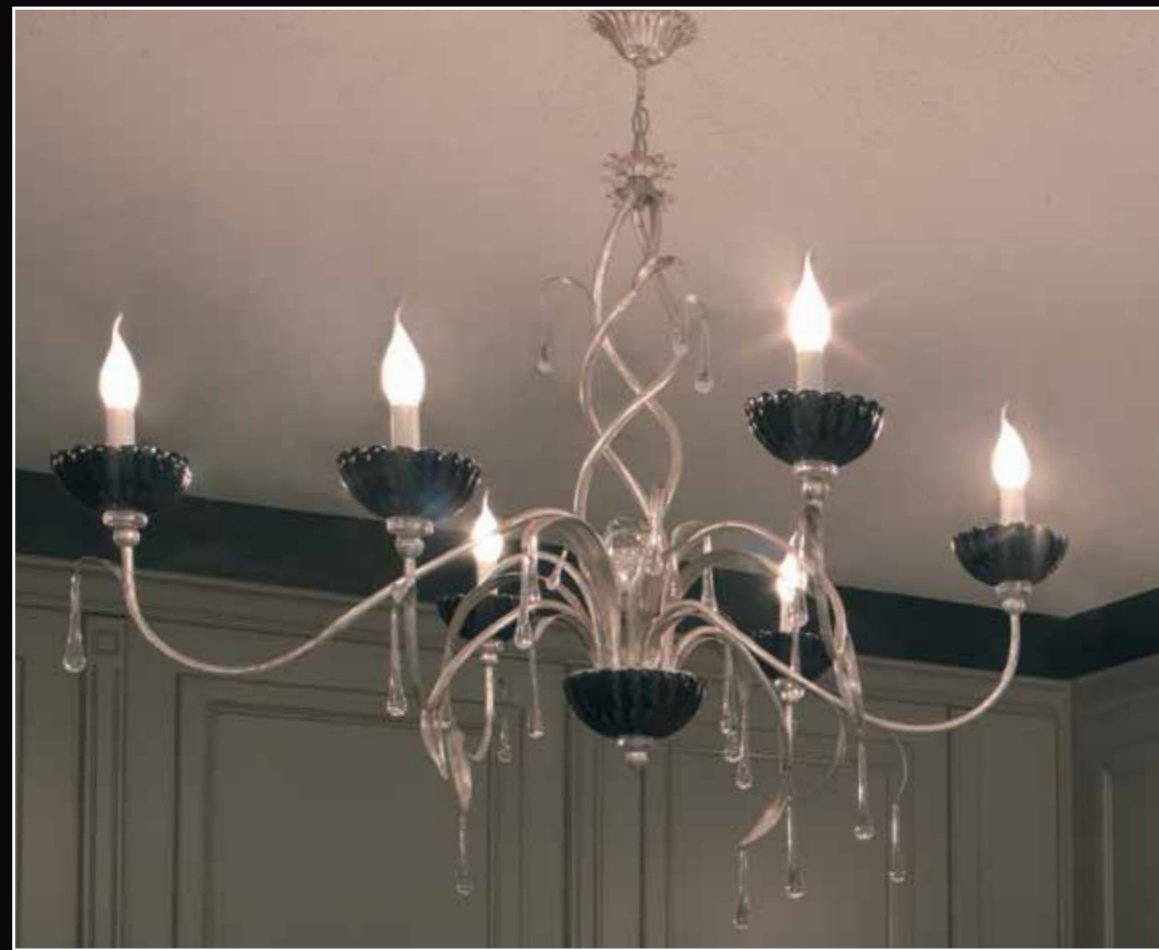
Art. 240 Lampadario 6 luci