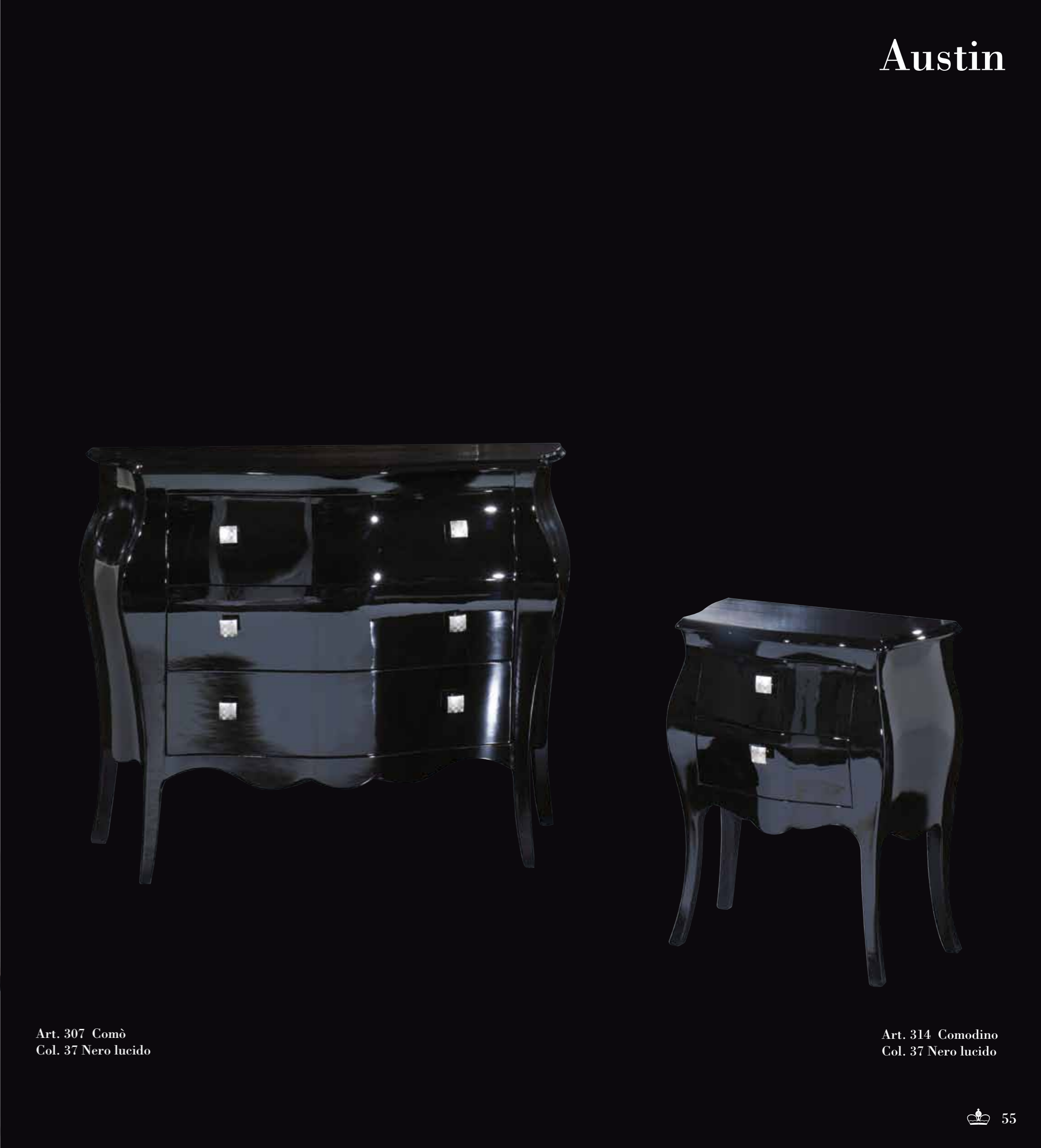
Art. 307 Comò Col. 37 Nero lucido