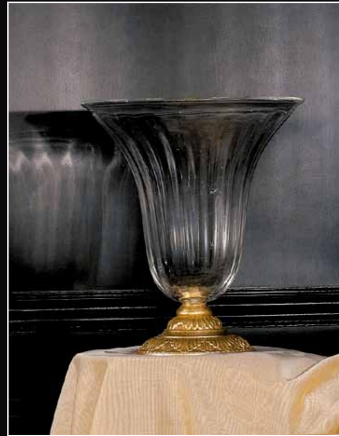
Art. 231 Vaso trasparente