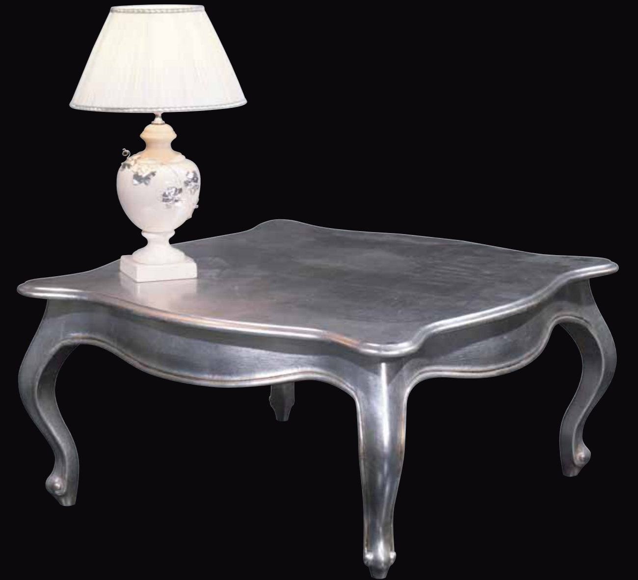
Art. 868 Tavolino quadrato Col. 24 Foglia argento