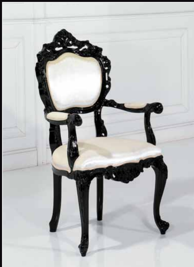
Art. 884 Sedia Col. 37 Nero lucido