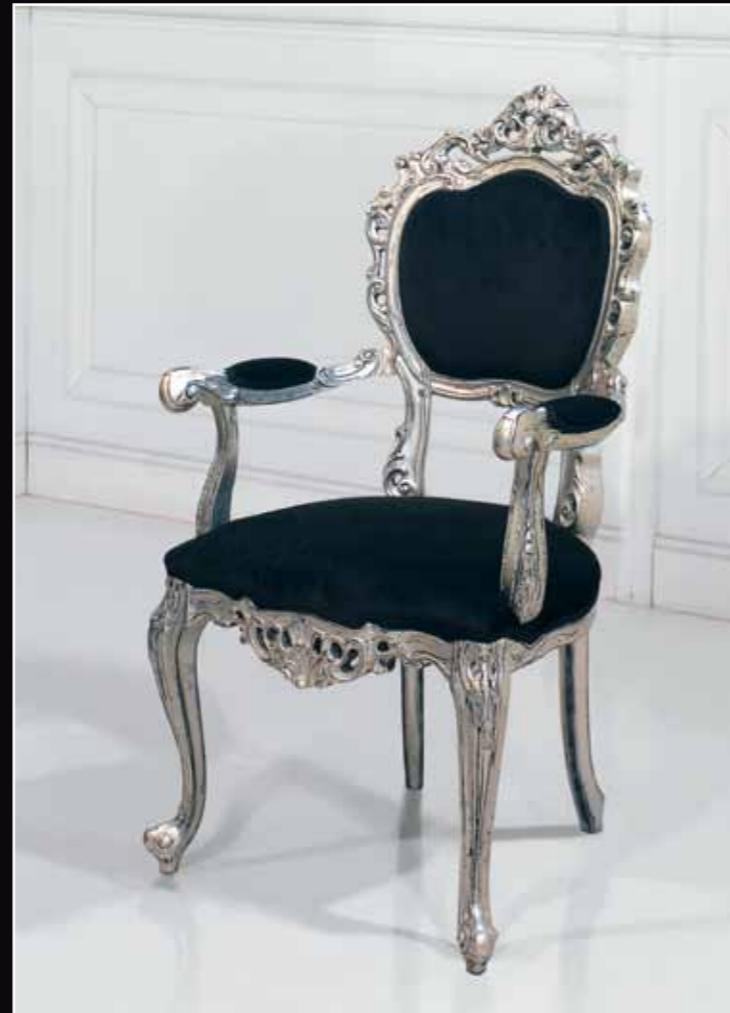
Art. 884 Sedia Col. 24 Foglia argento