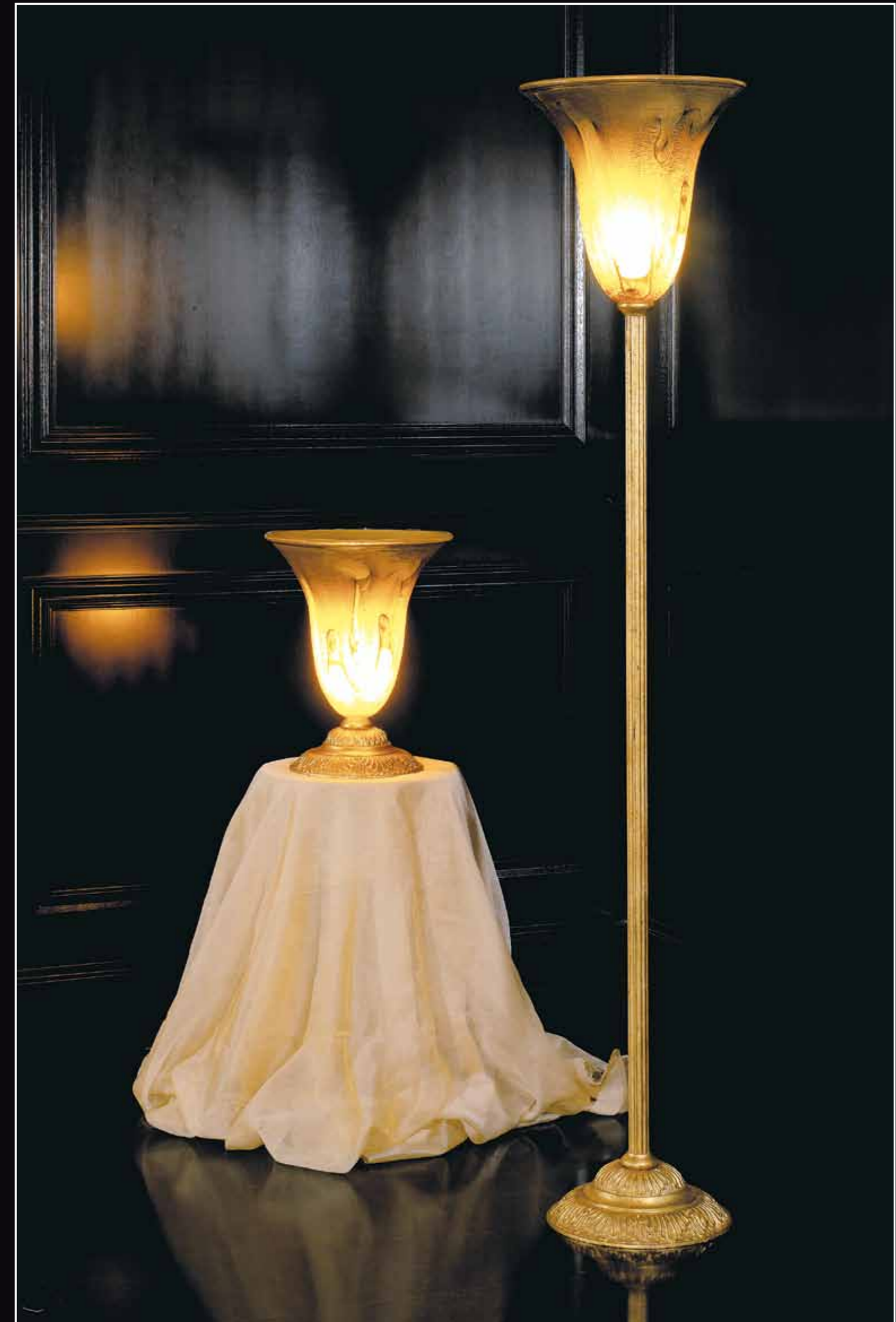
Art. 229 Piantana Vetro di Murano Art. 230 Lampada Vetro di Murano