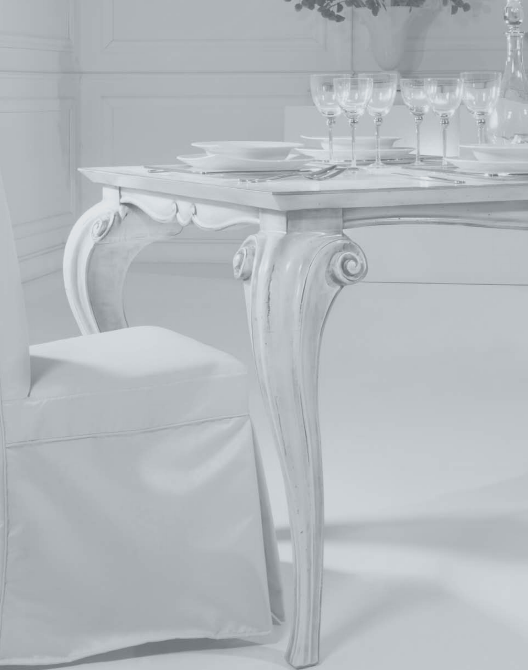
Fabian Art. 300 Tavolo Col. 29 Bianco antico