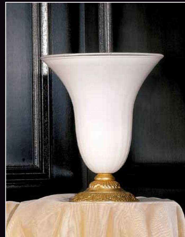
Art. 231 Vaso bianco