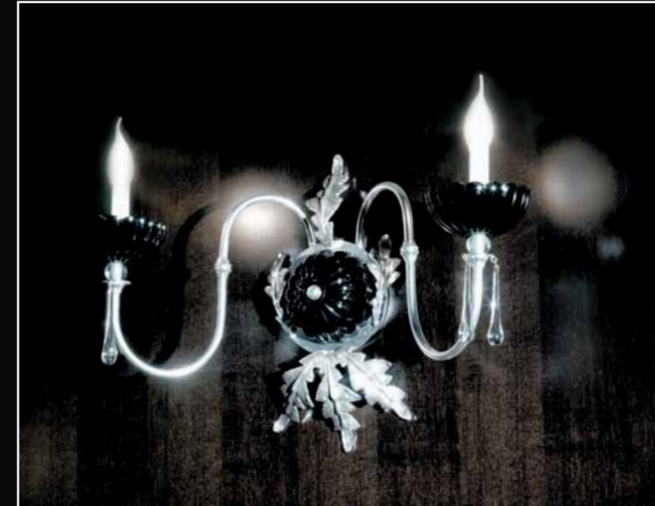
Art. 228 Applique