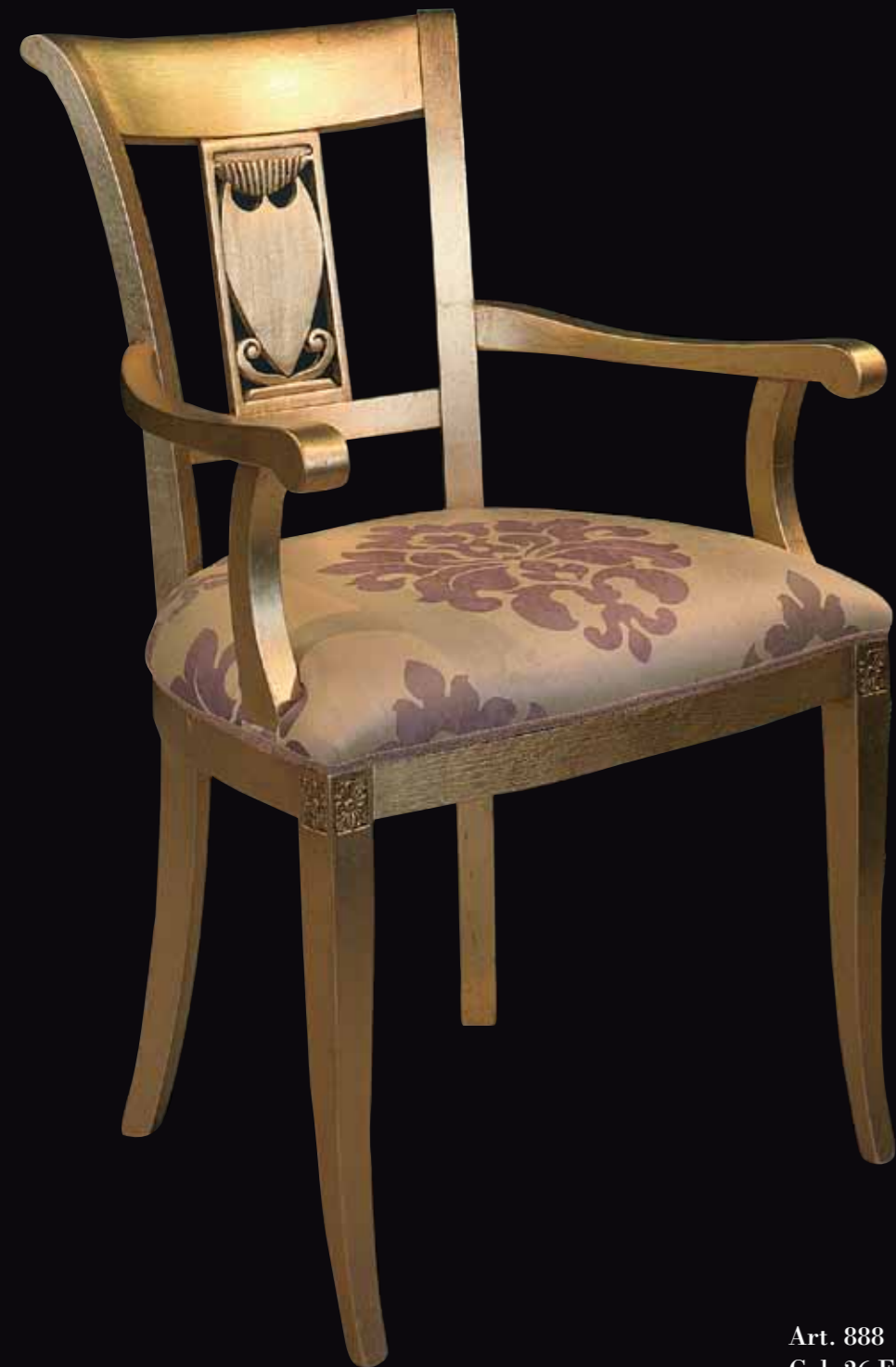
Art. 888 Sedia Col. 26 Foglia oro