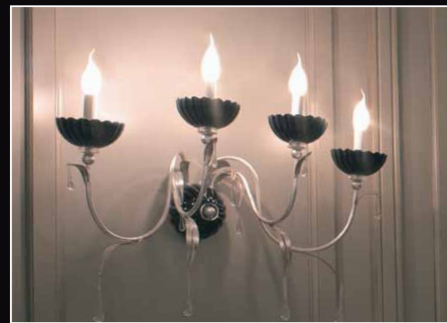
Art. 237 Applique 4 luci