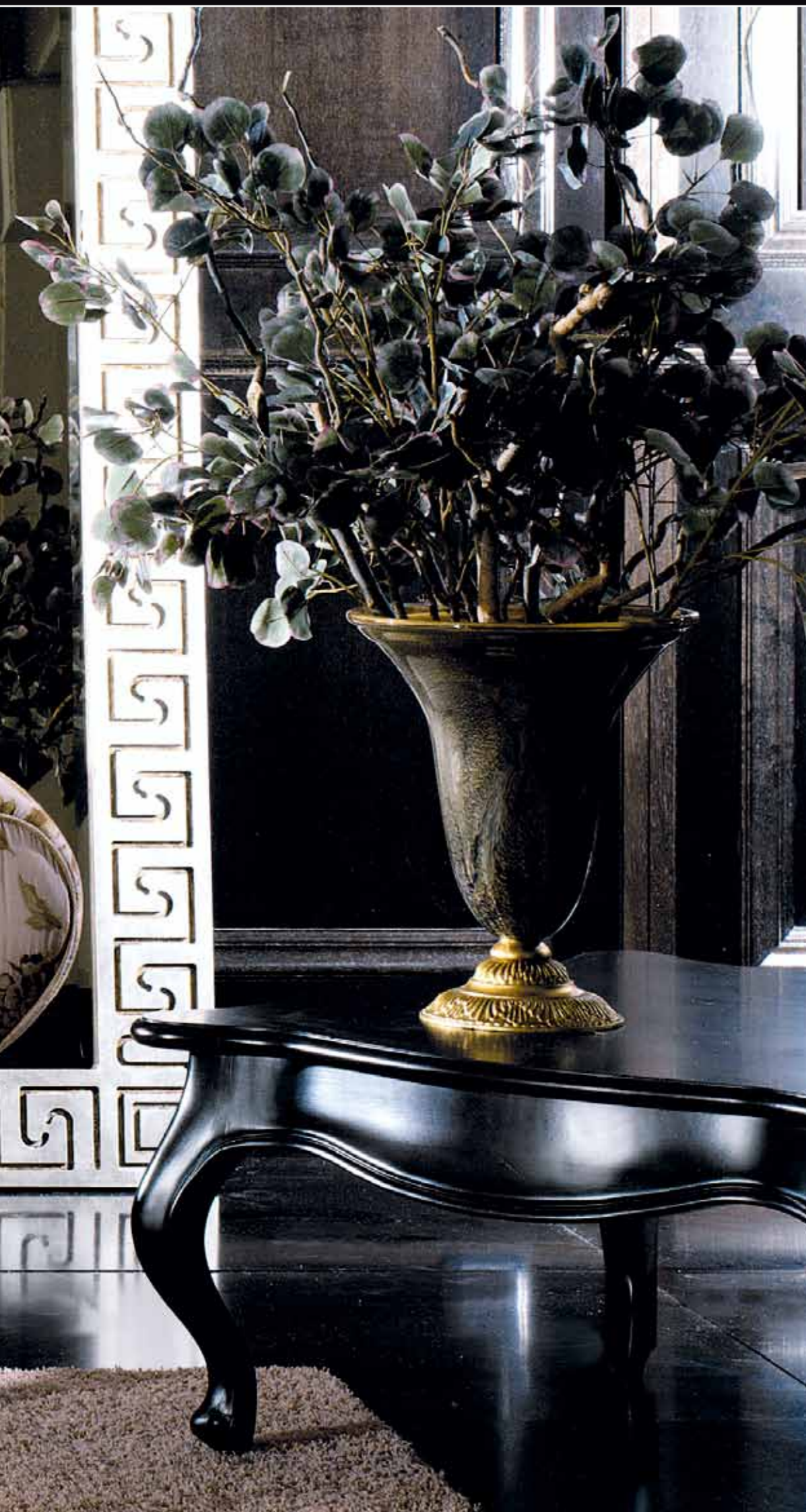
Art. 231 Vaso murano