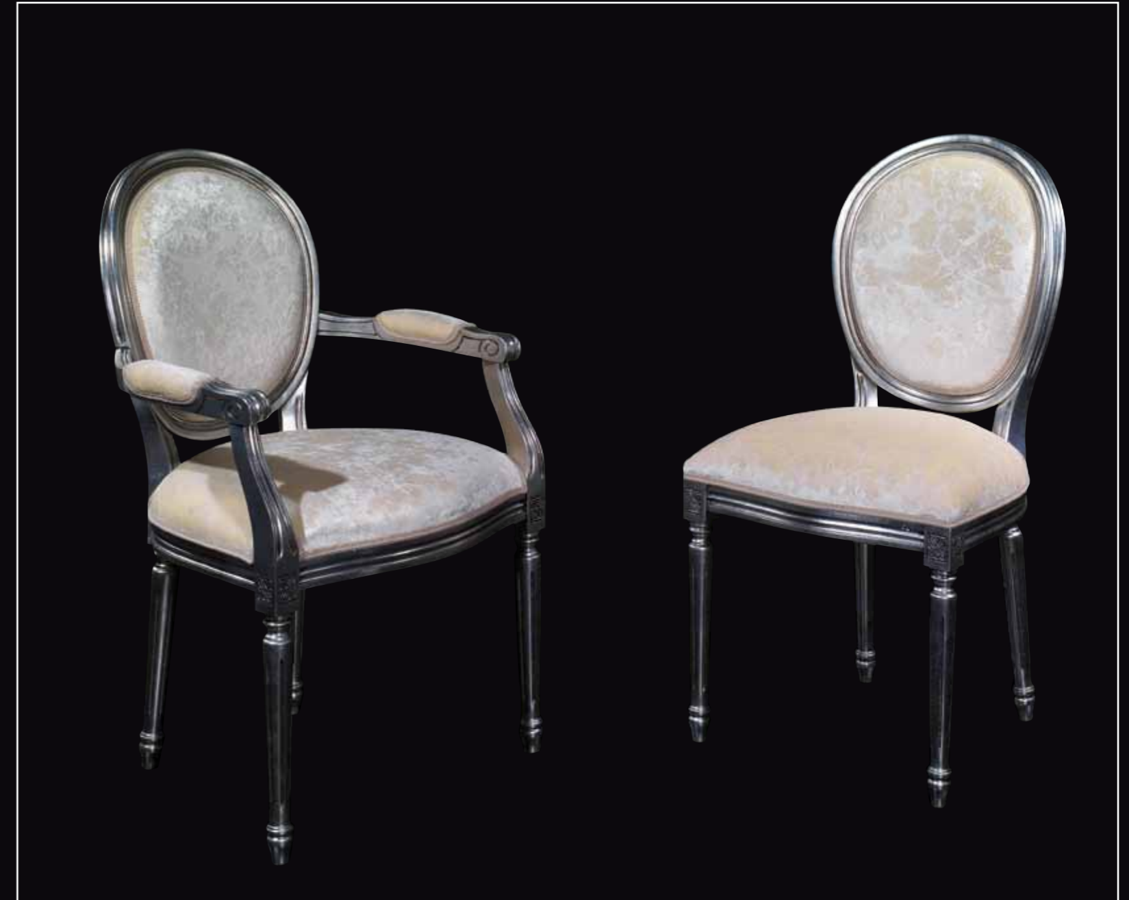
Art. 886 Sedia Col. 25 Old silver