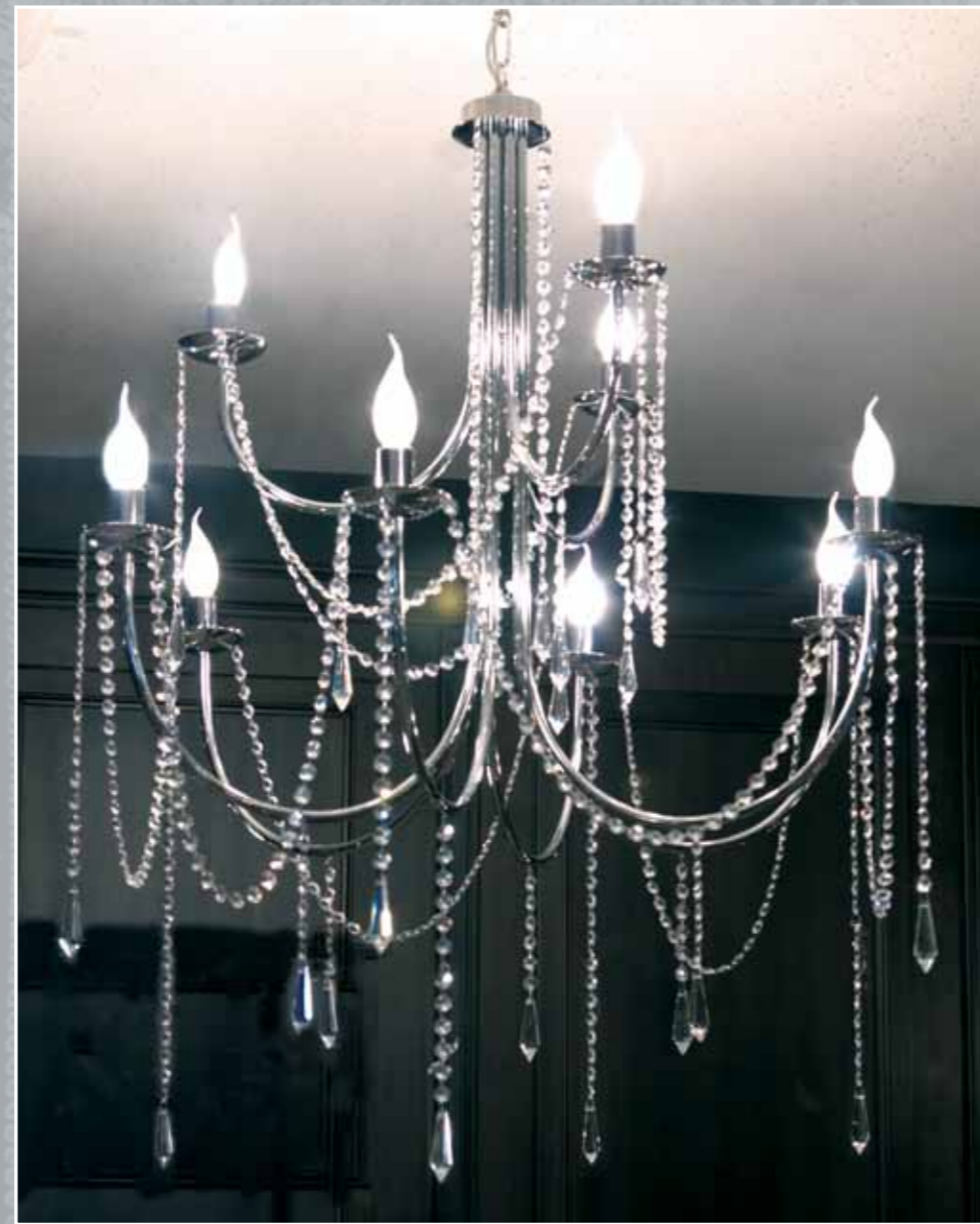
Art. 233 Lampadario 9 luci