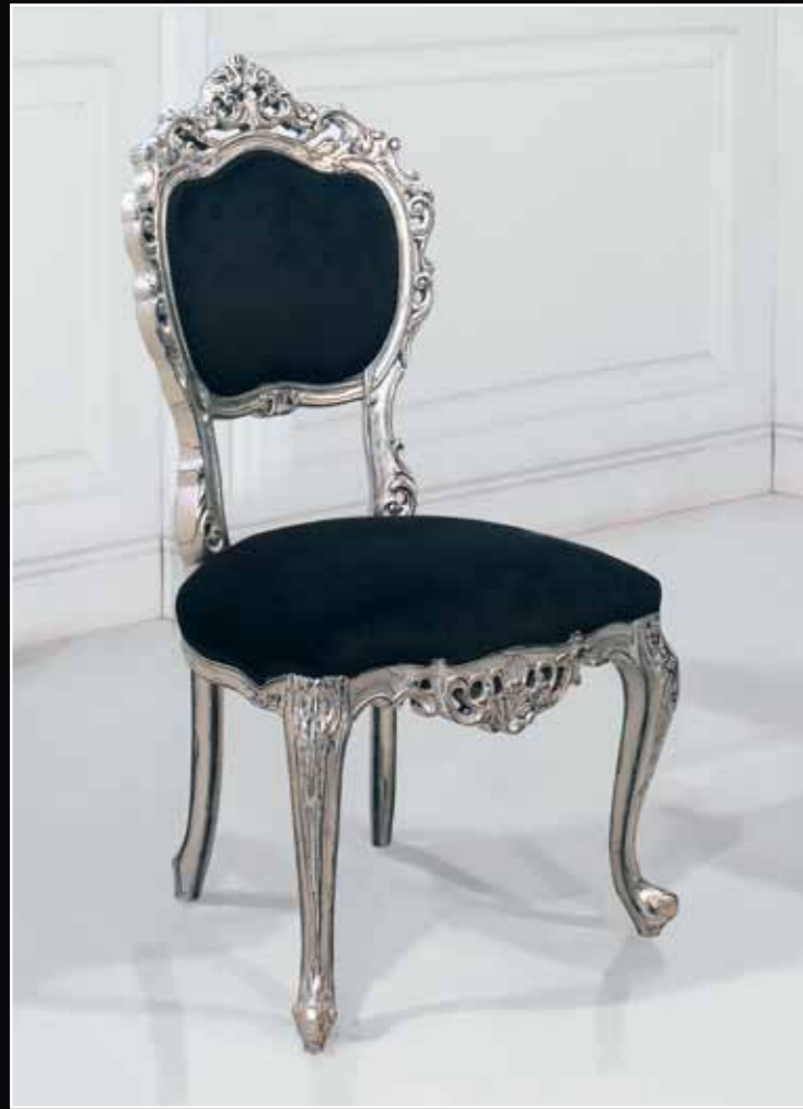
Art. 885 Sedia Col. 24 Foglia argento