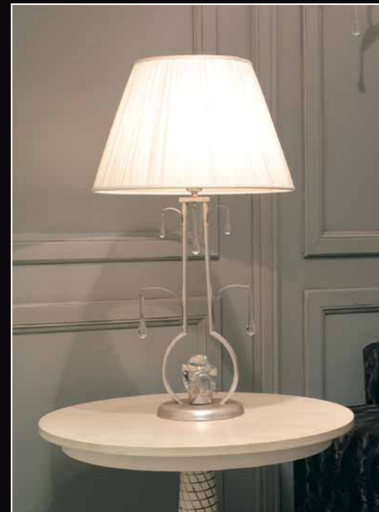
Art. 238 Piantana 2 luci Art. 239 Lampada da tavolo 1 luce