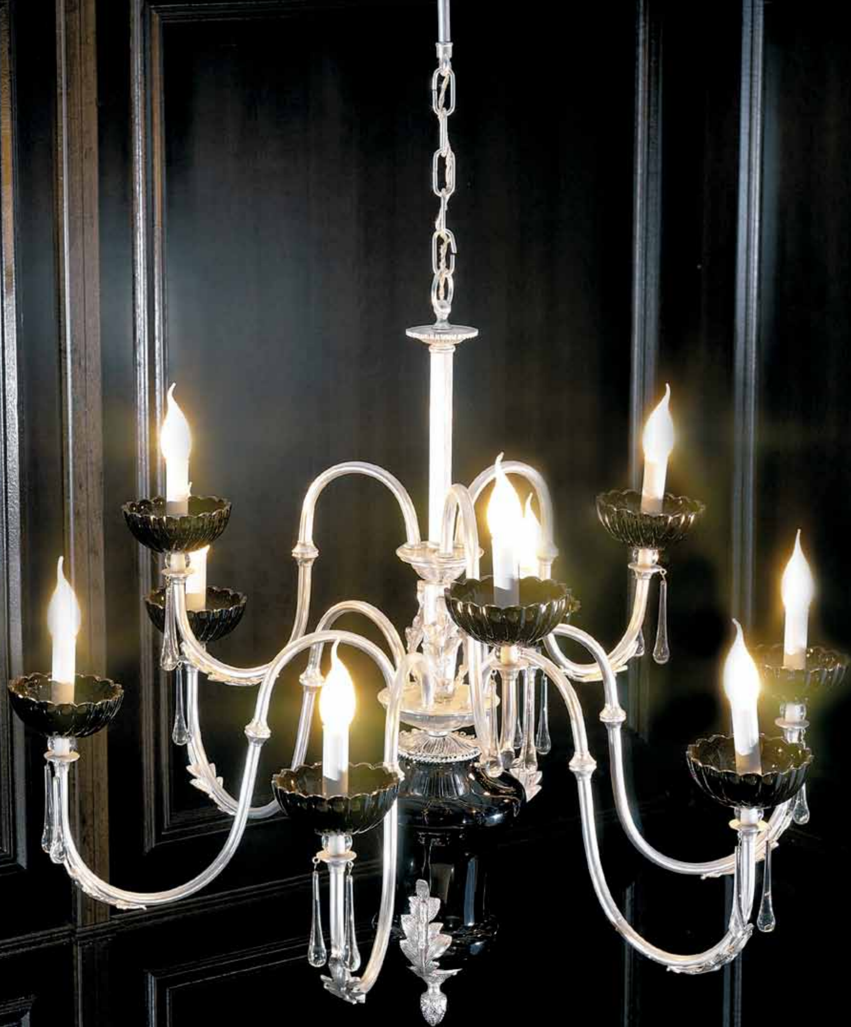
Art. 226 Lampadario argento