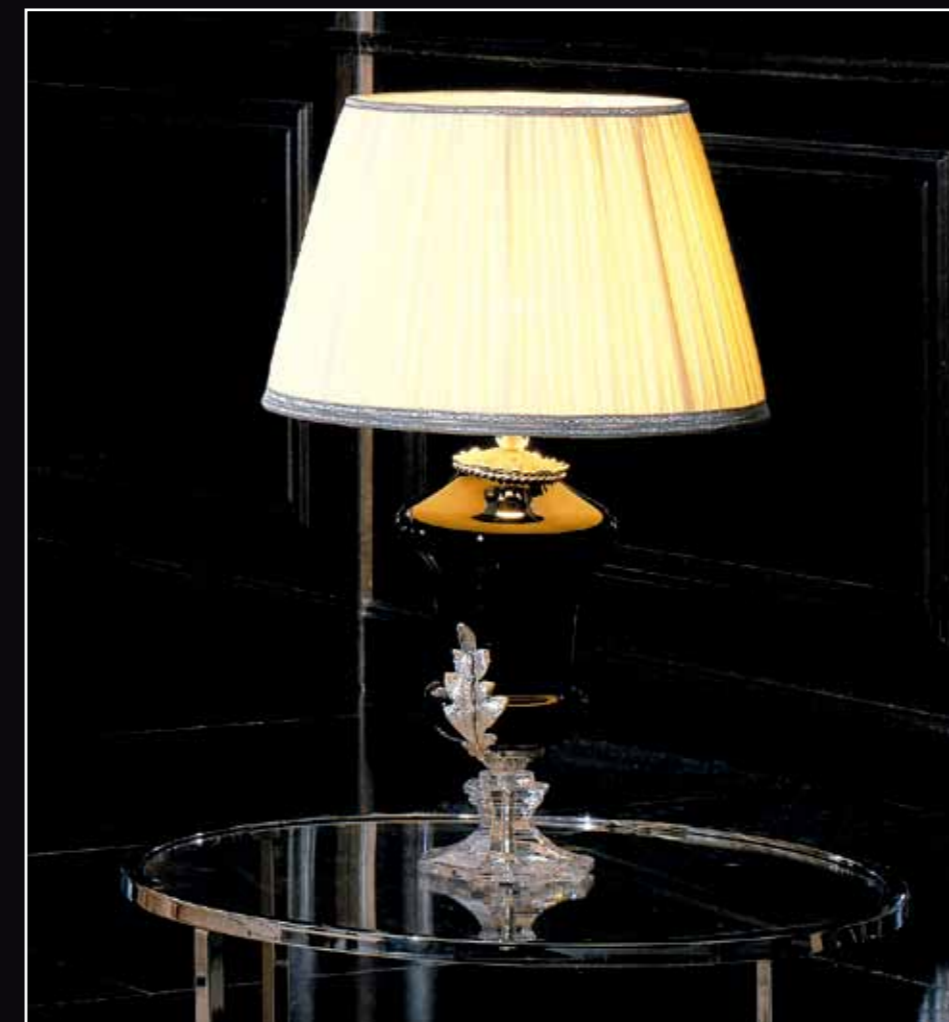
Art. 227 Lampada da tavolo