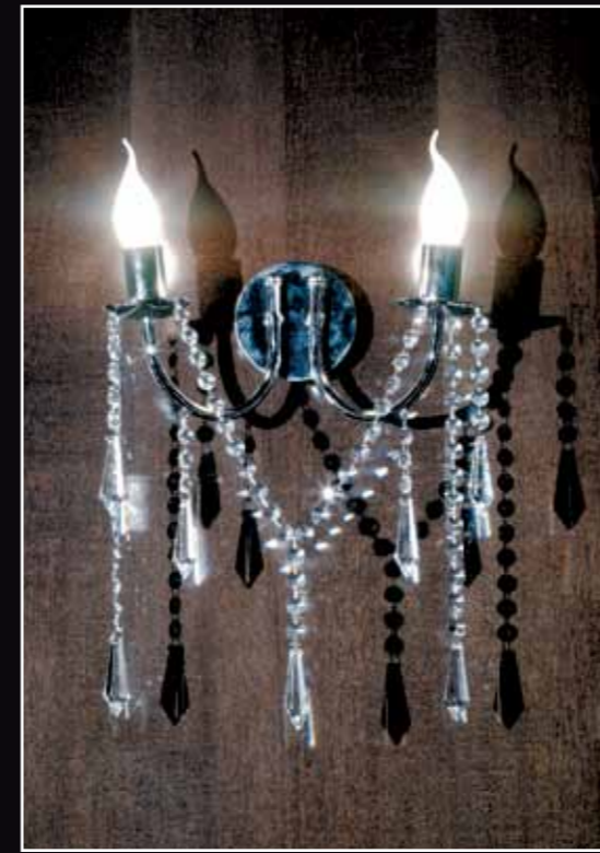
Art. 225 Applique