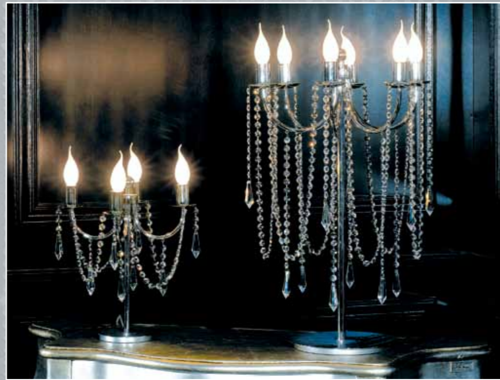
Art. 224 Lampada da comodino