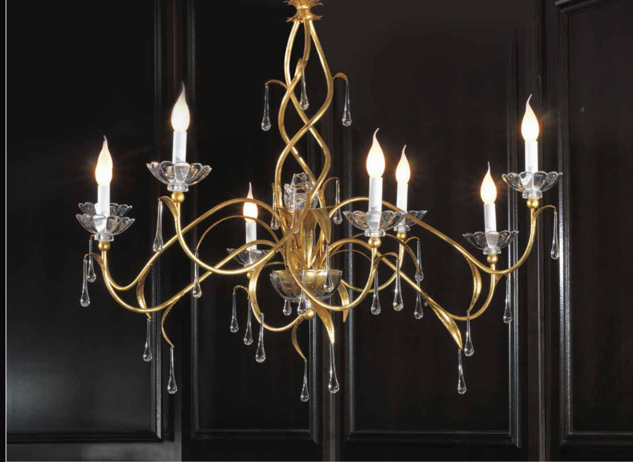
Art. 236 Lampadario 8 luci